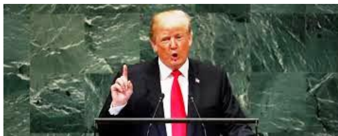
Trump vor der UN am 25. 09. 2018

https://www.youtube.com/watch?v=4KlpnPapquY